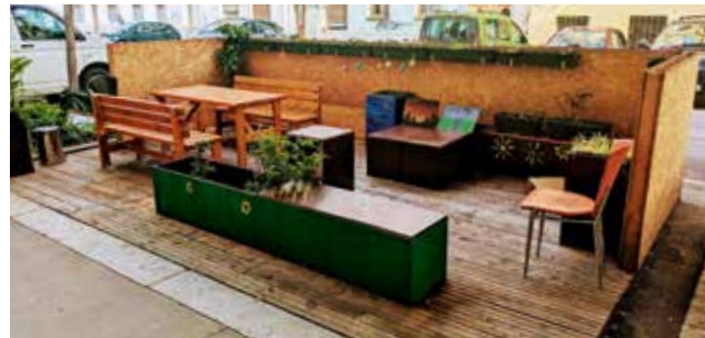
Das ist die Grätzloase in der Possingergasse.

Die beiden Wohnverbände haben 2 solche Plätze errichtet.