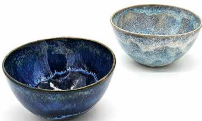
Das sind Schüsseln von der TS Tokiostraße.