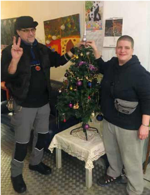
Weihnachten im KOMM