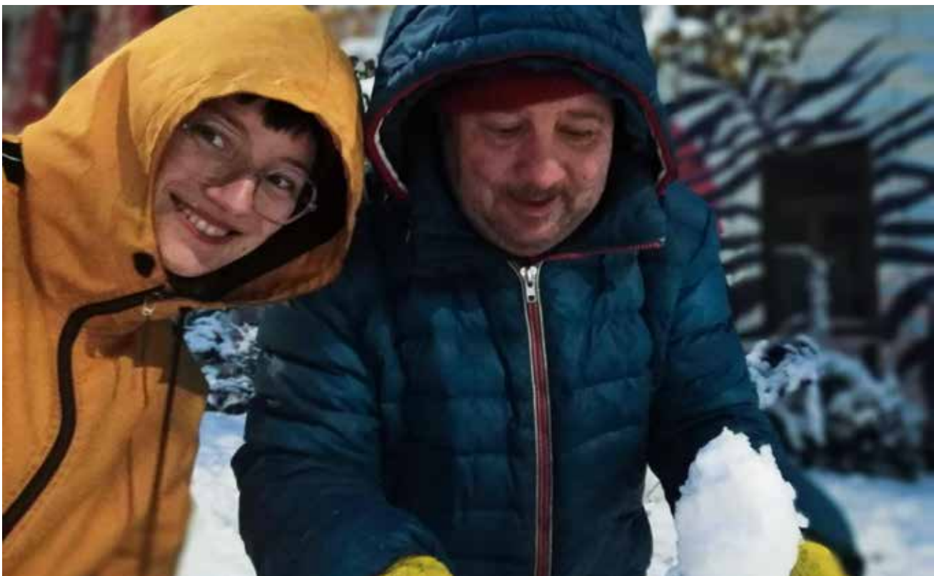
Hier wird ein Schneemann gebaut.