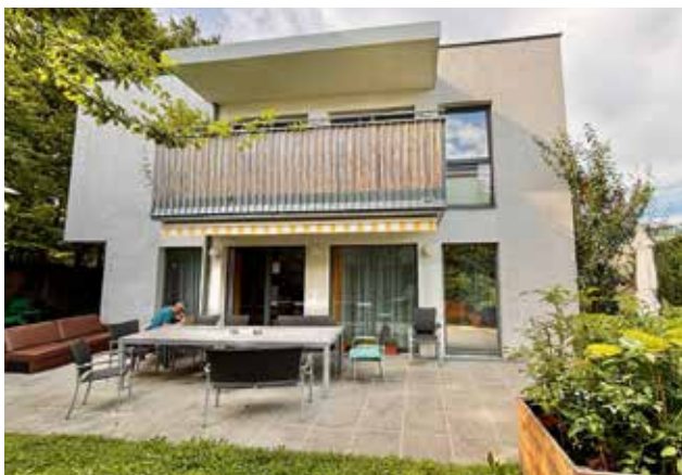
Das ist die WG Liesing.