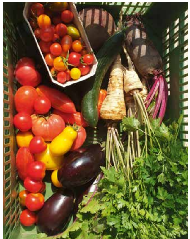
Das ist Gemüse vom Gärtnerhof.