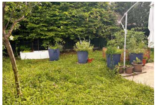
Das ist der Garten der WG.