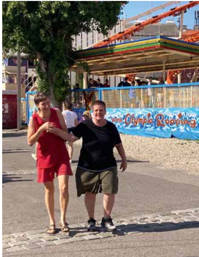
Ein Ausflug in den Prater